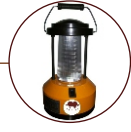
Solar LED Lantern