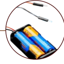
Hyper Sell Chamber